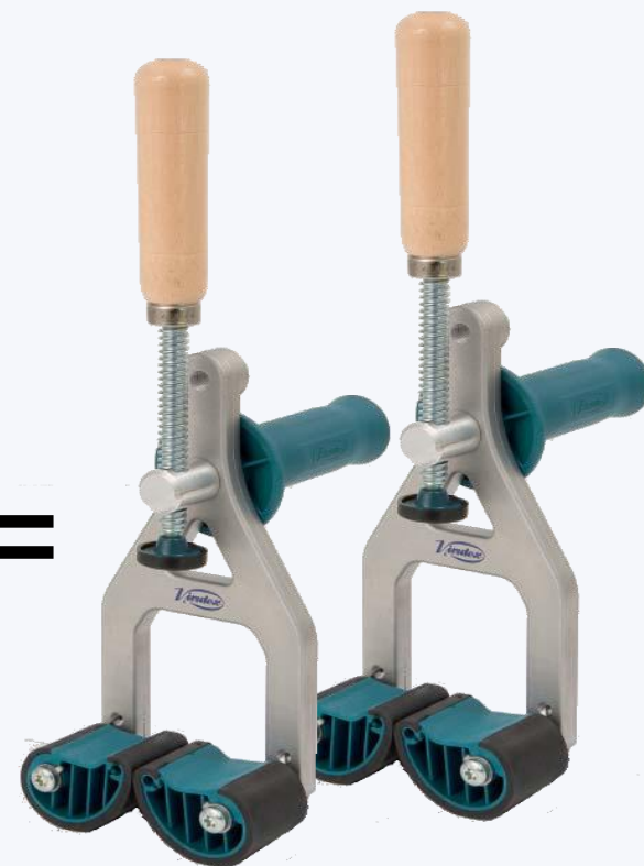
Арт. 8100200 x 2 шт